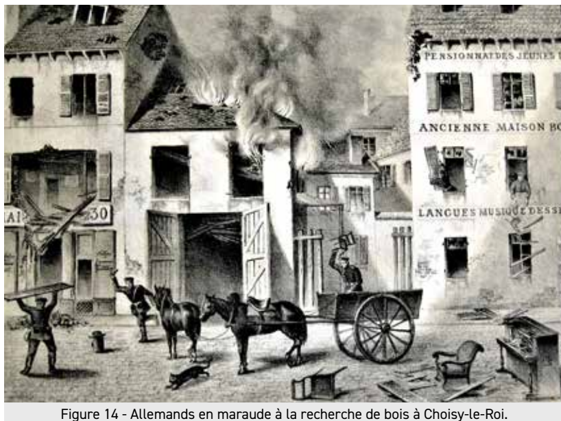
Figure 14 - Allemands en maraude à la recherche de bois à Choisy-le-Roi.

panneaux de la porte de la chambre du bon curé, brisent son secrétaire forcent la commode et les armoires... Ils lui ont tout volé, il ne lui reste plus de linge que la chemise qu'il a sur le dos... ; ce sont de vrais sauvages... Les hommes que nous avons en ce moment sont pires que tous ceux que nous avons eus jusqu'ici. Nous voici revenus au temps des Huns, des Vandales et des Normands... et encore ...ces gens avides comme une bande de pillards au milieu de nos ruines, explorent, cherchent avidement ce qu'ils pourraient encore trouver à nous enlever. Pendant trois heures je monte la garde avec mon chien.