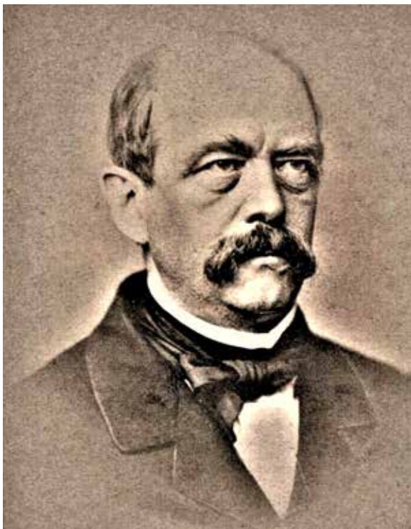
Figure 2 - Bismarck dans les années 1880.

de Yerres. Leurs relations couvrent un espace-temps d'un an allant du 15 septembre 1870, date de l'arrivée des Prussiens, au 15 septembre 1871, date de leur départ. Nous allons vivre cette période difficile au travers de leurs écrits.