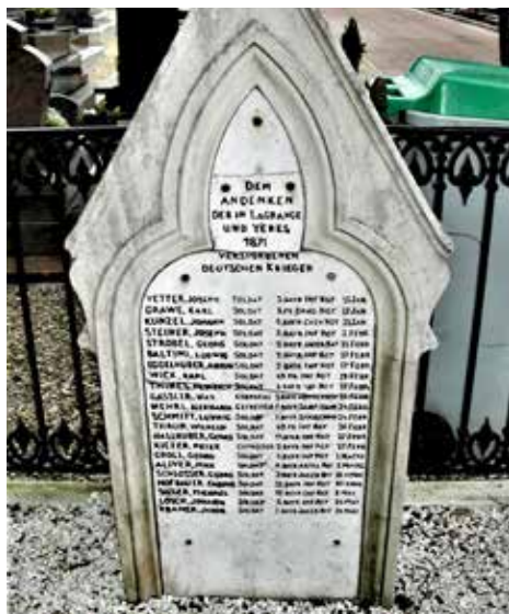
Figure 17 - Stèle à la mémoire de 22 soldats allemands morts au château de La Grange et à Yerres.

Il y a donc des décès à Yerres parmi les troupes occupantes et, comme deux religions sont représentées parmi les occupants, il y aura deux sites d'enterrement, en fait deux fosses communes. Voilà ce que nous dit Beaumont... Je vais au cimetière 21 . Le carré destiné aux non-catholiques et dont on a fait une énorme fosse commune, est plein de Prussiens. Nous pratiquons une brèche au mur afin de faire au dehors dans le terrain