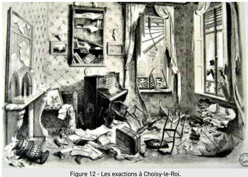
Figure 12 - Les exactions à Choisy-le-Roi.

et le couvert des populations, toujours sous prétexte de réquisitions, mot magique qui recouvre souvent les exactions de toute nature qui ne seront jamais ou, au mieux, mal indemnisées.