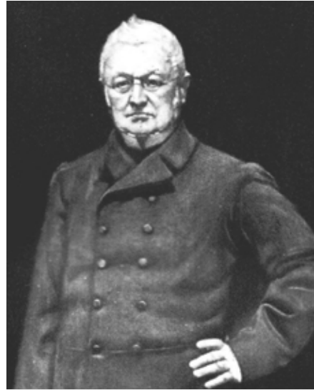
Figure 19 - M. Thiers.

Le 28 janvier, l'armistice est signé. Le 8 février, élections à une assemblée nationale convoquée à Bordeaux. Le petit czar nous contraint 28 à aller voter à Boissy. Pauvre élection au scrutin de liste. On a fait deux trois listes à Paris, nos gens jetteront dans la boîte celle qui leur tombera sous la main...M. Thiers n'était pas sur les listes, on y a écrit son nom à la plume...Paris avec son entêtement nous a perdu avec ses Jules Favre, ses Gambetta, ses Flourens 29 . Et il ajoute quelques jours plus tard