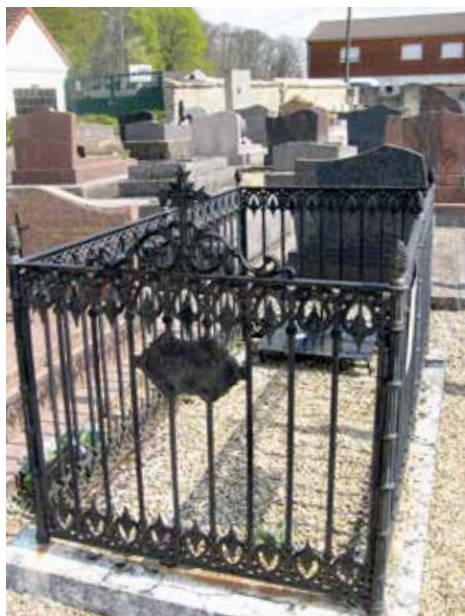
Figure 18 - Stèle de trois soldats français