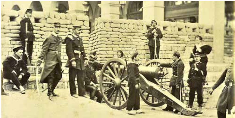
Figure 20 - Barricade à Paris rue de Castiglione pendant la Commune.