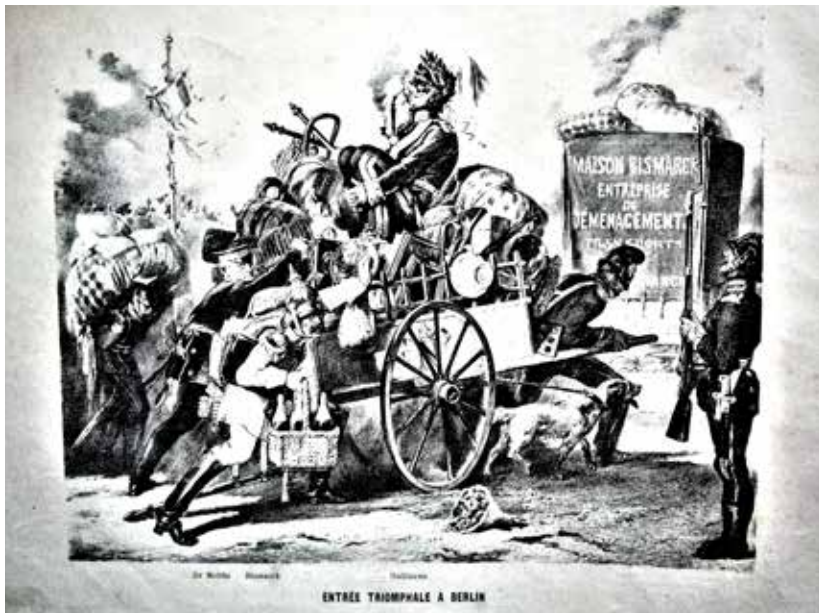
Figure 22 - Caricature parisienne montrant l'armée allemande rentrant à Berlin avec son butin.