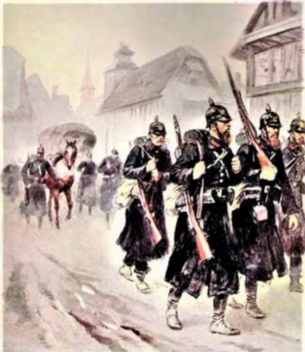
Figure 6 - Soldats prussiens.

Voilà comment le curé rapporte l'événement à la date du 15 septembre 1870 ... Tout à coup un bruit de piétinement de chevaux se fait entendre. C'est une troupe d'éclaireurs ! Le chef de cette cavalerie trouvant la petite montagne dépavée, ordonne de remettre les pavés en place, ou sinon on brûlera les maisons voisines. Voilà le pauvre curé chef d'atelier de pavage : tout le monde y met la main, hommes et femmes.