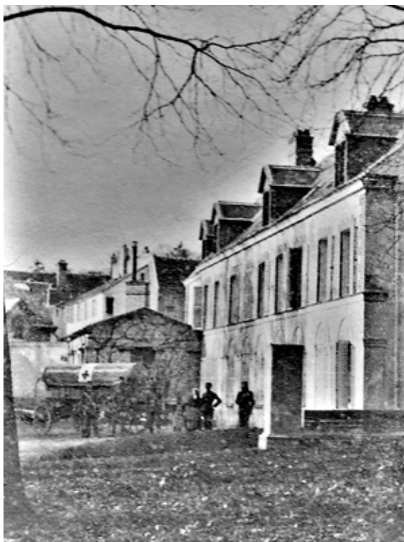
Figure 16 - La maison de M. Feron transformée en lazaret

Dans toutes les villes et villages occupés par les Allemands, un nombre important d'hôpitaux ont été installés en réquisitionnant des habitations privées. Gaudefroy écrit : ...ils ont établi au moins 8 lazarets dans les principales maisons et y ont soigné quelques militaires français faits prisonniers et il ajoute : ...pour meubler les lazarets, plus de 500 matelas ont été fournis ainsi que les objets de literie... Gaudefroy, lui-même, s'est vu déposséder de matériels de literie. Un