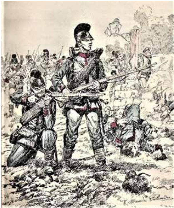
Figure 10 - Fantassins bavarois avec leur casque où se trouve suivant Beaumont une « chenille » qui les fait reconnaître.

Cette interruption des communications ferroviaires fait suite à la destruction par le génie français du tunnel de Nanteuil sur la voie Metz-Paris. C'est un