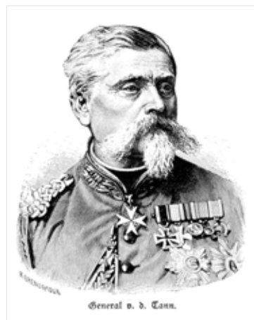
Figure 11 Le général bavarois von der Tann.