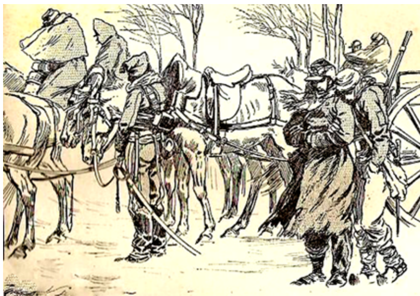
Figure 13 - Soldats français pendant l'hiver 1870-1871.