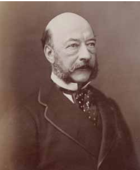
Figure 5 - Le baron Napoléon Gourgaud, maire de Yerres en 1870.

espèrent encore que les Prussiens ne viendront pas mais ils commencent aussi à trembler en voyant toutes les familles riches se sauver. Les jours suivants, c'est un sauve-qui-peut général. On ne peut plus avoir de place au chemin de fer, il faut y faire queue pendant quatre à cinq heures pour partir, c'est à étouffer dans les salles d'attente - quelle cohue ! quelle confusion ! quel pêle-mêle ! Il y a des montagnes de bagages. Il passe à chaque instant des convois de provisions, de bêtes, de matériel pour Paris. Les campagnes au sud d'Yerres se sont ébranlées, les longues files de déménagement sur Paris deviennent plus longues et plus nombreuses, c'est comme un grand fleuve qui coule de la campagne vers la capitale, c'est effrayant. Les gens d'Yerres n'y tiennent plus, ils partent aussi et vont se réfugier à Paris avec les animaux domestiques, des provisions et ce qu'ils peuvent emporter de leur mobilier. Le temps est superbe, un soleil radieux éclaire nos tristesses. Tous les jours nouveaux départs.