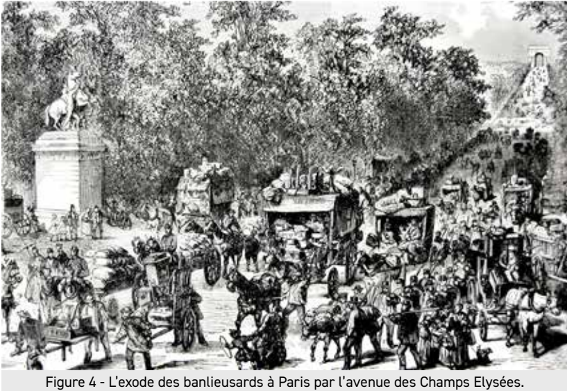
Figure 4 - L'exode des banlieusards à Paris par l'avenue des Champs Elysées.

La guerre est déclarée par la France à la confédération de l'Allemagne du Nord le 19 juillet 1870 ; la Prusse y jouera le premier rôle. Rapidement les déboires s'accroissent et les armées allemandes progressent de victoire en victoire vers Paris. Voici les événements tels que les décrit le curé :