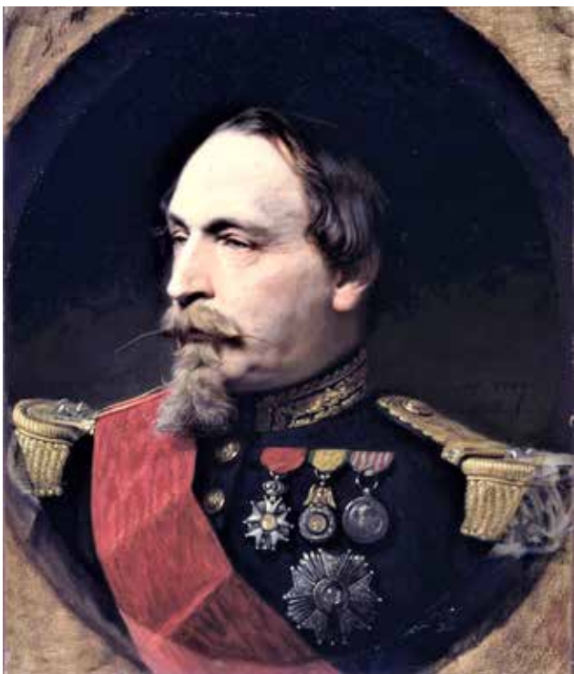
Figure 1 - Napoléon III.

La guerre de 1870 n'a pas directement touché toutes les communes françaises : une bonne moitié du territoire national a échappé à la guerre ou à l'occupation qui s'en est suivie. En revanche, Paris ayant été le principal objectif des armées allemandes, Yerres, située à vingt kilomètres de la capitale, a naturellement subi les conséquences du conflit. La ligne d'encerclement fortement fortifiée au-