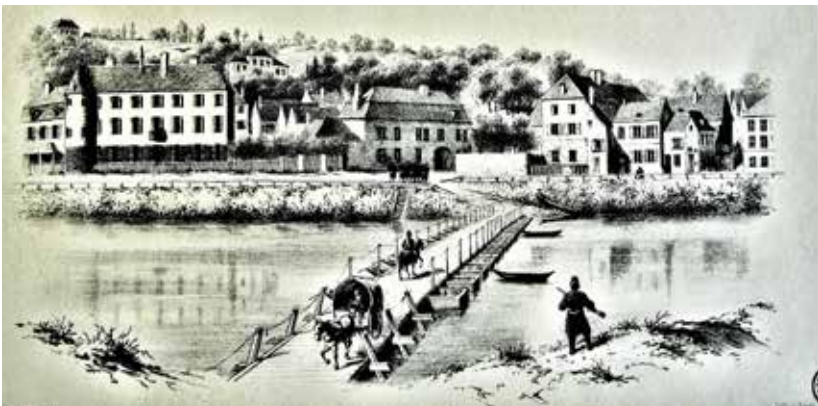
Figure 8 - Un pont jeté sur la Seine par l'armée allemande à Ablon, près de Villeneuve-Saint-Georges. La rive en face est la rive gauche du fleuve qui coule donc de gauche à droite.

Le pont détruit est celui de Villeneuve-Saint-Georges. Il l'a été par un officier du génie français le 13 septembre : le curé note le bruit de l'explosion et ajoute que ...la Seine... en ce moment a presque plus d'eau... Les bateaux qu'il voit passer serviront effectivement à lancer un pont sur la Seine. L'ouvrage, commencé le 17 vers 13h, pourra être emprunté le même jour par