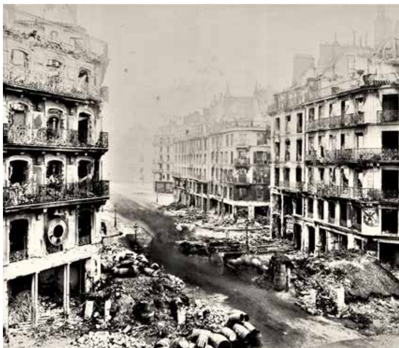
Figure 21 - Carrefour de la rue de Rivoli avec la rue Saint Martin après la Commune.

À l'inverse de ce qui s'était passé quelques mois plus tôt, les événements font fuir de Paris ceux qui le peuvent ; une peur chasse l'autre et le curé écrit le 6 avril, jour du Jeudi Saint ... On se sauve de Paris...la population est doublée. Campagnards, Parisiens, Bavaois sont entassés dans les maisons...Ici, on ne craint pas les réquisitions des communards. Les hostilités entre l'armée de Versailles, mise sur pied par Thiers, et la Commune vont commencer le 2 avril et, petit à petit, les Versaillais vont investir Paris. Le 21 mai, ils entrent dans la capitale par le Point du Jour. Commence la semaine sanglante qui fera en huit jours plusieurs dizaines de milliers de victimes. Depuis le mont Griffon, on voit distinctement Paris en feu 30 .