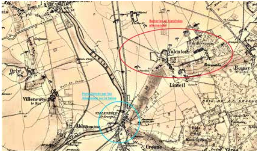
Figure 9 - Représentations des organisations allemandes sur une carte provenant de l'état-major allemand : artillerie et tranchées dans le cercle rouge, ponts sur la Seine dans le cercle bleu.

Après la capitulation de Metz (le 27 octobre 1870), toute une armée allemande a contourné Paris par le sud-est et s'est di-