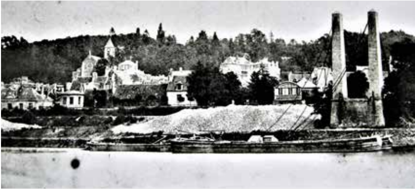
Figure 7 - Pont suspendu de Villeneuve-Saint-Georges détruit.

à boire aux soldats altérés par la chaleur du soleil et la poussière. Ils boivent sans rompre les rangs.