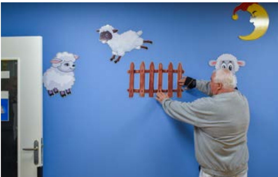
Des travaux de rafraîchissement ont été réalisés dans les écoles, comme ici, une nouvelle peinture avec pose de motifs dans le dortoir de l'école maternelle des Camaldules.