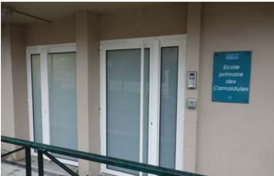
Les portes d'entrée de l'école élémentaire des Camaldules (rue des Camaldules, au niveau de l'arrêt des cars scolaires) ont été remplacées par des nouvelles, plus sécurisées.