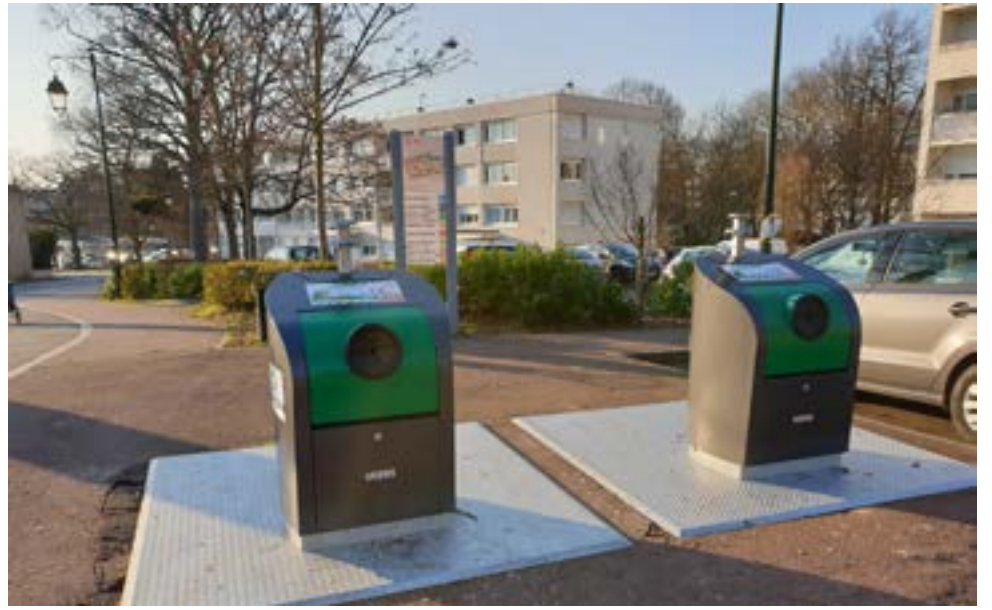
Le Sivom a remplacé des points d'apport volontaire du verre (ici, aux Tournelles), dont certains étaient régulièrement détériorés.