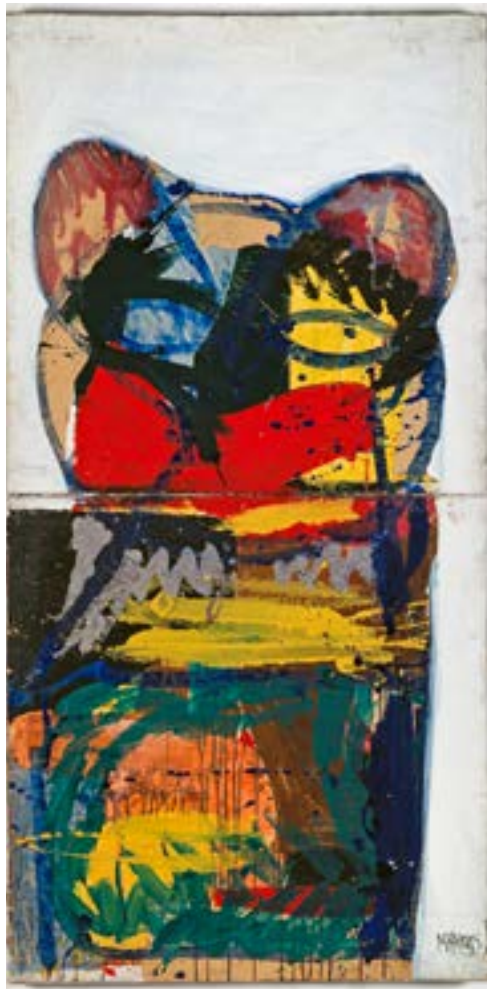
▲ Sans titre , (série Donald Duck), 1963 technique mixte sur toile © Markus Lüpertz / ADAGP, Courtoisie de la Galerie Michael Werner Märkisch Wilmersdorf, Cologne & New York

Au fil du temps, les centres d'intérêt de Markus Lüpertz évoluent et s'inscrivent dans sa peinture. L'artiste réalise aussi des bronzes. Pour lui, la sculpture est le prolongement de la peinture. « Le pas suivant » qui poursuit le travail de la toile en dépeuplant le tableau pour « lâcher les figures dans la réalité ».