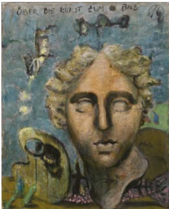
Arcadie (Cassandre), 2018 (détail) - Technique mixte sur toile © Markus Lüpertz / ADAGP, ▲ Courtoisie de la Galerie Michael Werner Märkisch Wilmersdorf, Cologne & New York

Le cinéma et la médiathèque, enfin, sont des lieux chers aux Yerrois qui les fréquentent. Et là aussi, les rendez-vous ne manquent pas !