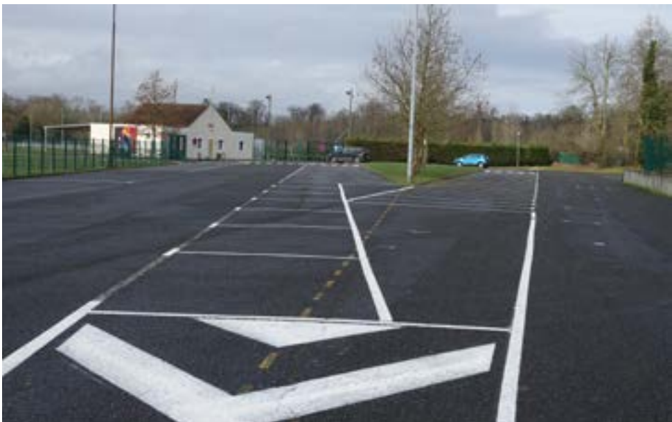
Les stationnements du parking du stade Léo Lagrange ont été retracés.