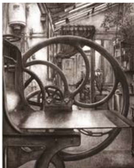
◀ Atelier René Tazé IV , Erik Desmazières, eau-forte, aquarelle & roulette, 1992.

▷ Un catalogue d'exposition sera vendu à la boutique.