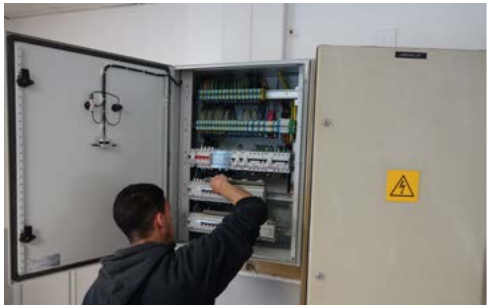
Un nouveau tableau électrique a été installé à l'école élémentaire des Camaldules.